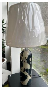
13 – Birgitte Sandvik Lampe med skærm (H 55)