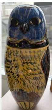
7 - Pylle Søndergård Keramik – Ugle (H 30)